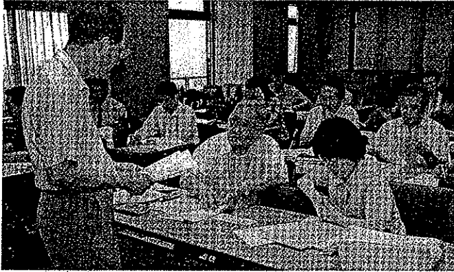
静岡市内外の約50事業者が参加した「エコアクション21」自治体イニシアティブ・プログラムセミナー＝市役所静岡庁舎