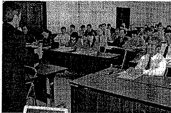
静岡市内外の38事業者が参加した「エコアクション21」自治体イニシャティブ・プログラムのフォローアップセミナー—市役所静岡庁舎

認証取得に向けて各事業者が策定した環境活動計画には、二酸化炭素排出量、廃棄物排出量、総排水量などの削減に向けた環境目標(数値目標)、具体的な取り組みが盛り込まれている。 企業や団体はこの計画を実践し、審査を通れば「環境経営」の認証を受けられる。