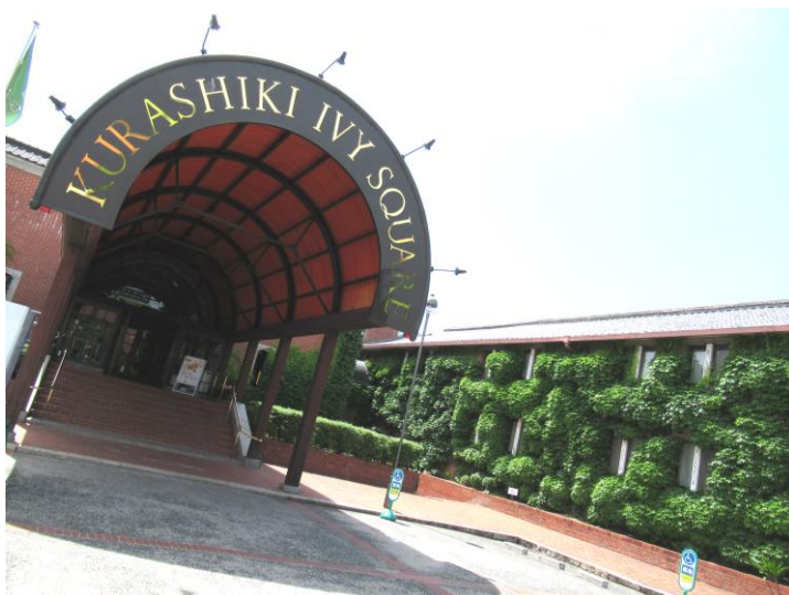
【左】倉敷アイビースクエア

また、研修会で使用する「アイビーエメラルドホール」は、2018 年 10 月にオープンした倉敷市最大の会場です。