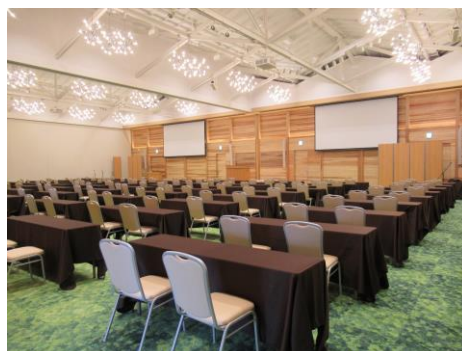
【右】アイビーエメラルドホール