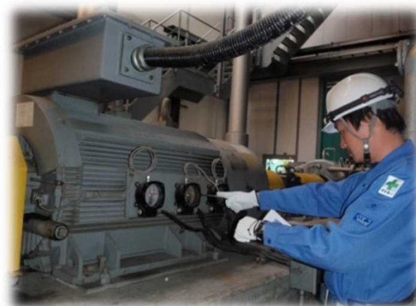
蒸気タービンの点検