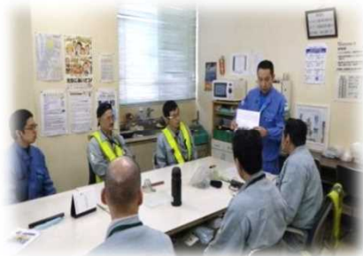
EA21活動内容及び 問題点の説明