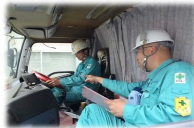
エコドライブ運転の教育(大型車)