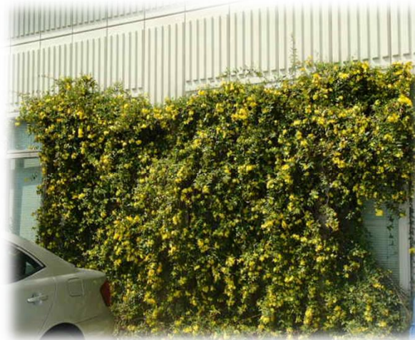
グリーンカーテン