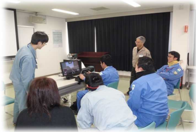
堺市環境局の出張講座