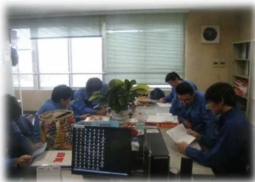
焼却炉 過去トラブルと対策の検証