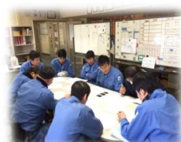
ボイラーの取り扱い 講習会