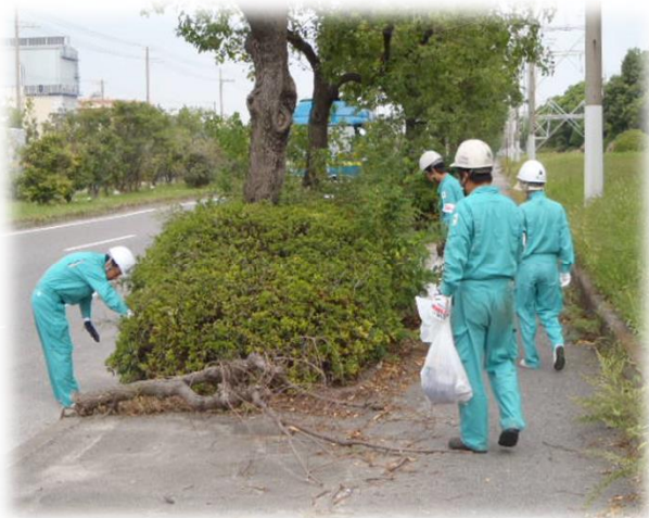
場外周辺歩道の美化活動